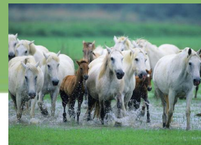
La filière cheval

Direction de l'environnement, du développement durable et de l'agriculture